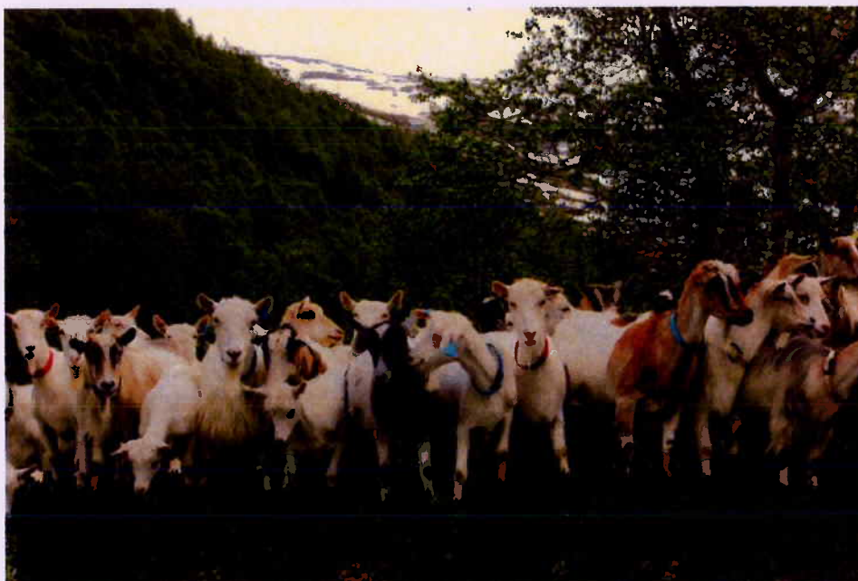
Sørge for at geita og bonden trives i Beiardalen.