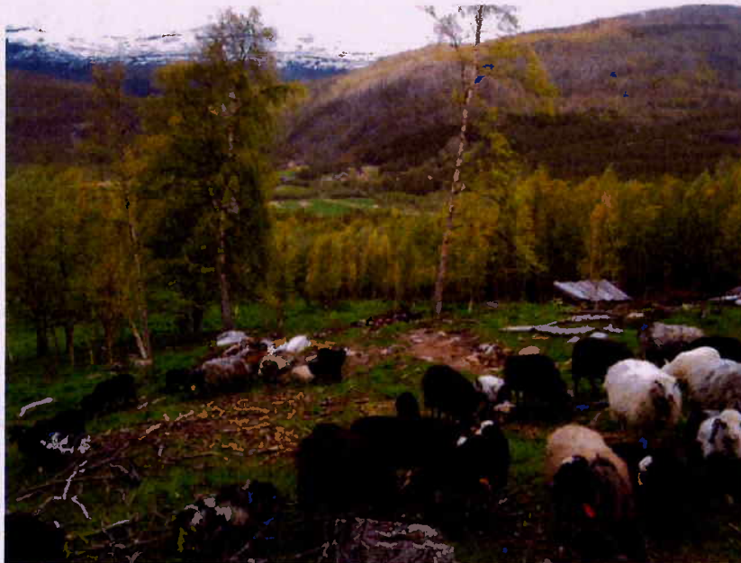
Utnytte landbrukseiendommenes naturgitte ressurser.

Produksjonsmål: Øke melke- og kjøttproduksjonen med 10 % i planperioden.