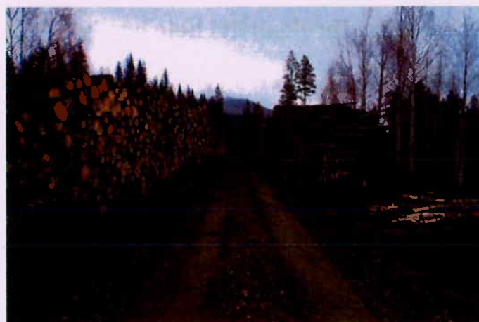
Det er et stort potensiale i skog i Beiarn.