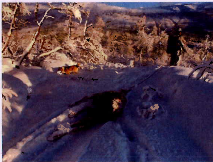
Hjortevilt kan nyttes i næringssammenheng.