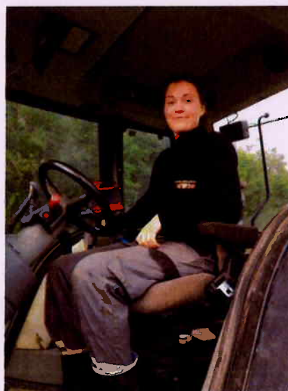
Satse på ungdommen.